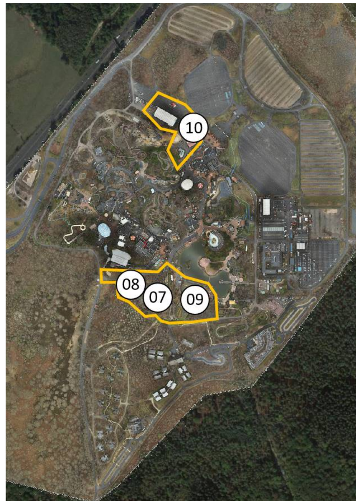
Figure 4 : Localisation des opérations incluses dans la phase 2 (Parc Astérix)

Une deuxième opération concernant les ENR devrait être menée : la création d'une chaufferie géothermie ou biomasse ainsi que d'un réseau de chaleur associée. Ces opérations sont prioritaires, et en sont aujourd'hui à l'état de l'étude d'opportunité, disponible en annexe du dossier d'Autorisation Environnementale (pièce L – Annexes) .