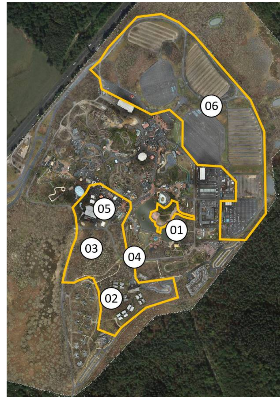
Figure 3 : Localisation des opérations incluses dans la phase 1 (Parc Astérix)