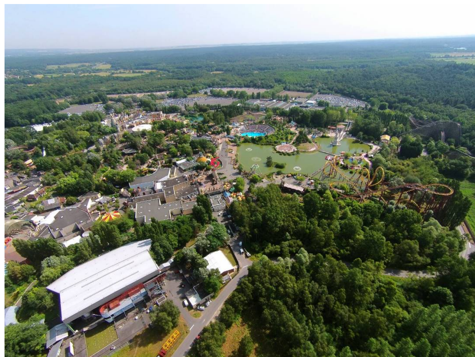
Figure 1 : Vue aérienne globale du Parc Astérix

On y retrouve également 3 hôtels, pour 450 chambres : Les Trois Hiboux, La Cité Suspendue et Les Quais de Lutèce, qui font du Parc Astérix une véritable destination de séjour.